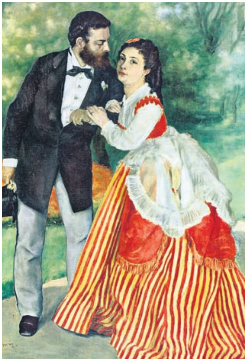
Vertraut und trotzdem höflich. Pierre-Auguste Renoir: Das Ehepaar Sisley.

Während vergangene Zeiten die Illusionen pflegten, bemühen sich aber Philosophie, Wissenschaft und Kunst heute – im Verein mit den Medien, wäre hinzuzufügen –, sie zu zerstören. Das Bekenntnis ist heute im Vor-